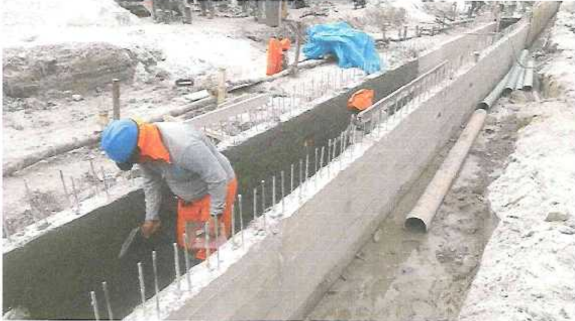
FOTOGRAFÍA 12: VACIADO DE MORTERO ARMADO EN TECHO DE ALCANTARILLA EN LA CALLE URARINAS