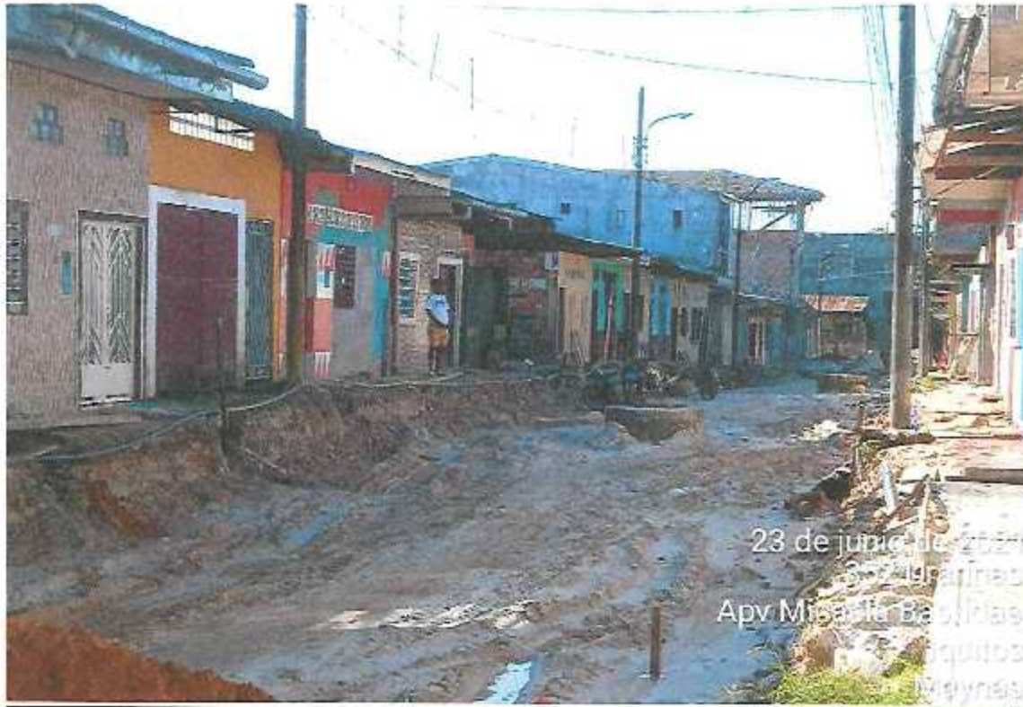
FOTOGRAFÍA 08: CONEXIONES AUXILIARES CON TUBO DE 6" EN LA CALLE 4 DE SETIEMBRE