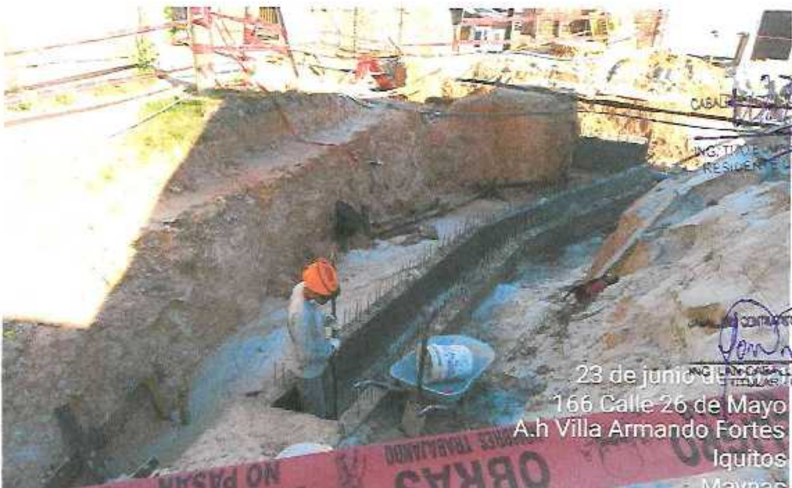
FOTOGRAFÍA 10: CONEXIÓN DE SISTEMA DE ALCANTARILLAS EN LA INTERCEPCION DE LA CALLE 26 DE MAYO Y CALLE URARINAS