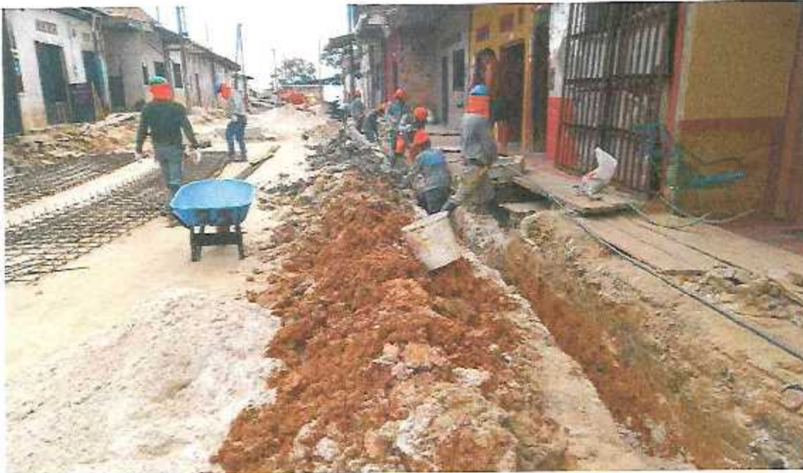
FOTOGRAFÍA 20: HABILITACION DE MADERA PARA ENCOFRADO DE LOSA DE PAVIMENTO